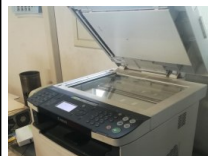
#51: Attrezzature per Ufficio