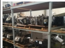
#53: Magazzino Motori per Veicoli