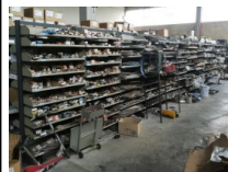
#52: Magazzino Ricambi per Veicoli