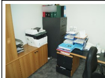
#64: N. 2 Stampanti e Arredi Ufficio