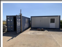
#21: Container e Box Ufficio